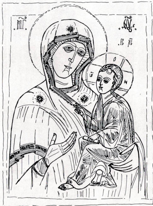
Ikonographisches Schema der Hodegetría. Ganz oben links und rechts die griechisch-kyrillischen Abkürzungen für «Mutter Gottes». Ueber dem Nimbus des Kindes: «Jesus Christus». Die drei Buchstaben im Kreuznimbus des Kindes: «Der Seiende».

brachten, litt es auch unter den Auseinandersetzungen zwischen den Katholiken und Protestanten und Mohammedanern. Vor diesem Hintergrund ist das Ereignis im nordöstlichen Ungarn zu sehen, von dem hier die Rede sein soll. Im November und Dezember des Jahres 1696 sahen die Gläubigen in der griechisch-katholischen Kirche des Ortes Pócs bei Zabolcz aus den Augen einer zwanzig Jahre zuvor gemalten Marien-